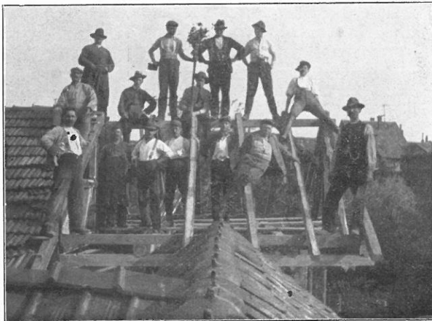
Richtfest der neuen Werkstätten.