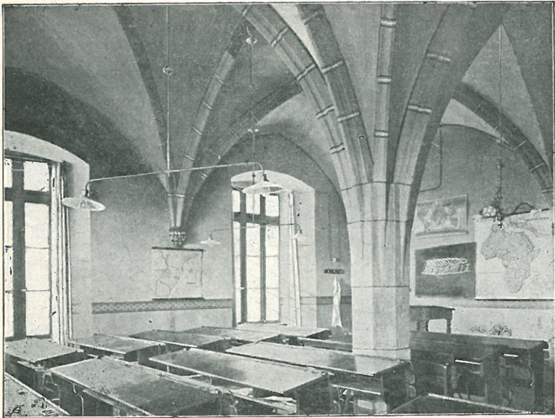
Der bisherige Hörsaal.