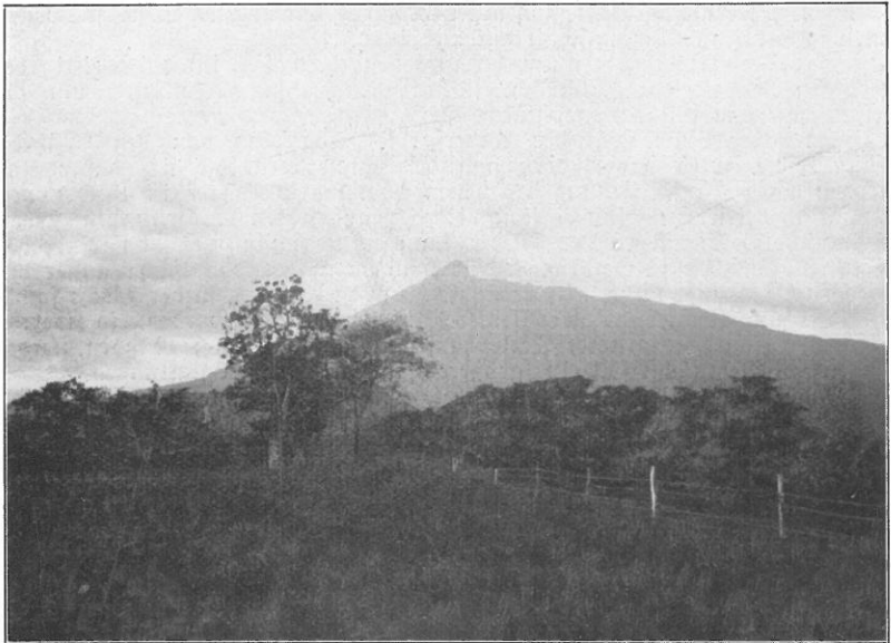
Abendstimmung am Meru.

N. N., Sumatra-Westküste: Bücher, Zeitungen, Insekten.