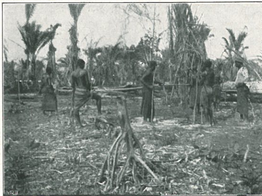
Siehe Pflanzung Kamerun S. 89. ff.